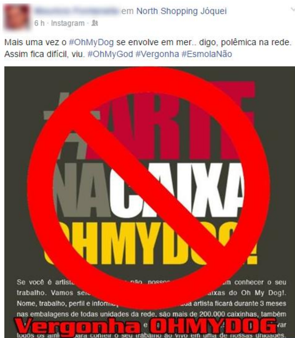
Figura 2: compartilhamento da insatisfação sobre a campanha

A campanha teve uma repercussão negativa entre os clientes, pois instantes após a publicação, já havia inúmeros comentários ressaltando o descontentamento. Muitos até compartilharam a postagem em seu perfil pessoal, deixando claro a insatisfação.