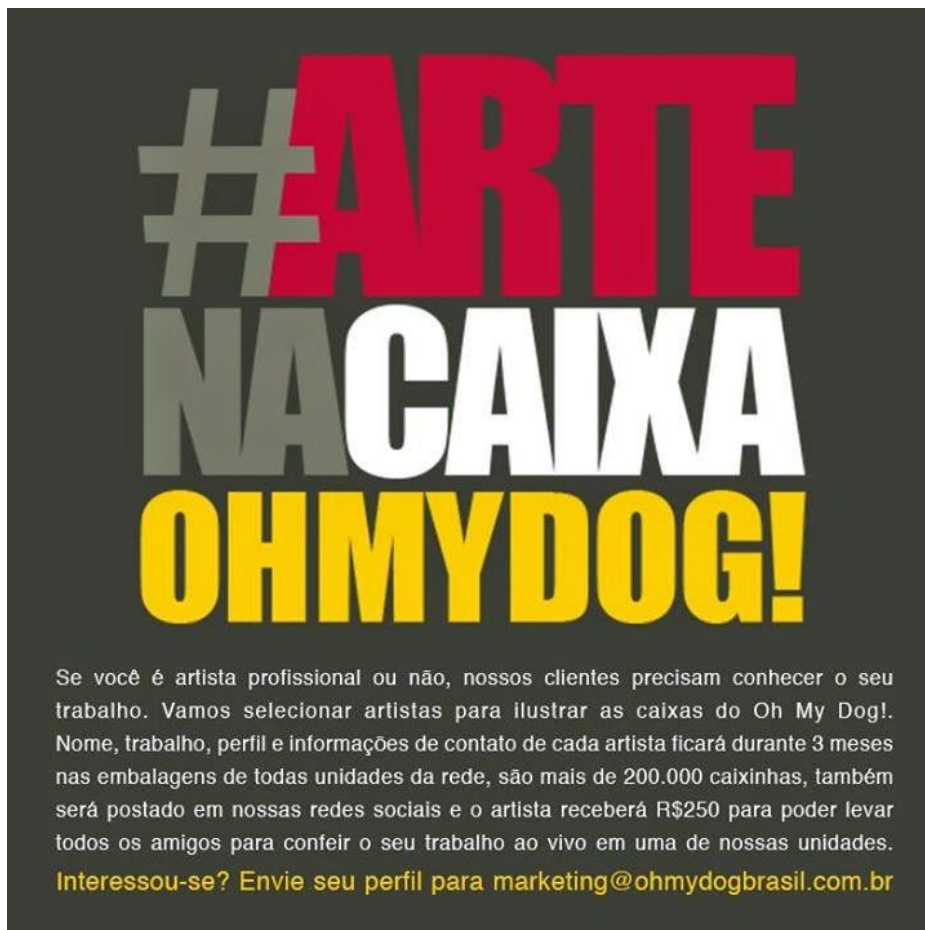
Figura 1: imagem do primeiro post da Campanha "#artenacaixaohmydog".

Nas redes sociais online, a empresa é bem ativa e já está desde 2012. Atualmente ela tem perfil ativo no Twitter, Instagram e no Facebook. A rede social que iremos destacar neste trabalho será o Facebook, pois é onde o público mais interage com a marca, possuindo cerca de 93 mil fãs em sua página do Facebook 5 e publicando diariamente cerca de 3 postagens diárias. Nessa rede, no dia 8 de Maio de 2015, a empresa divulgou pela primeira vez sua nova campanha: #artenacaixa ohmydog!”, em que convidava “artistas profissionais ou não” a ilustrarem as caixas do duplo hot dog em troca de visibilidade e de uma quantia de R$ 250 para utilizar nas franquias.