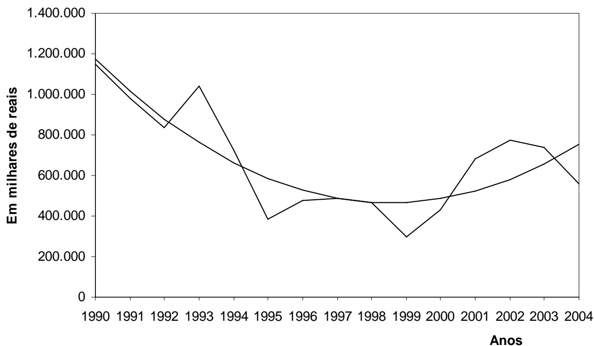
Figura 1 - Valor da produção anual de cacau em amêndoas no Estado da Bahia. Em reais de março de 2004.

O valor da produção, no primeiro ano do estudo, foi de 1.147,8 milhões de reais, o que corresponde ao valor máximo do período. No ano de 1999 ocorreu o menor valor da produção de cacau, correspondente a 296.877 milhões, elevando-se, em 2004 para 560.697 milhões. A redução do valor da produção entre 1990 e 2004 foi de 51,15%.